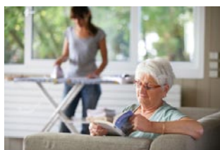
Repassage chez Mme Leblanc