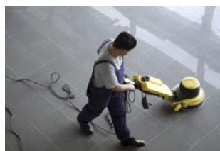
Lustrage des sols de Dupont Assurances