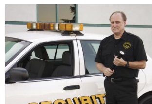
Ronde de jour n°4, étape 12